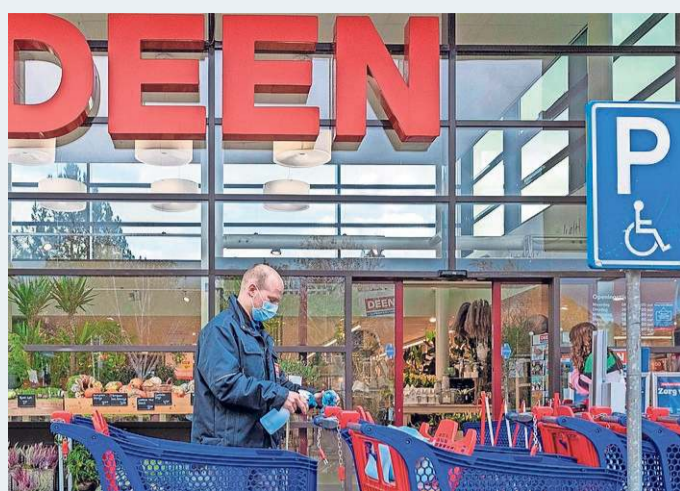
Een medewerker reinigt winkelwagens.