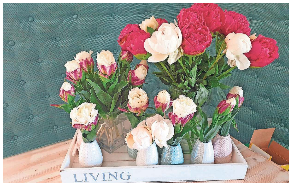
Een blad vol bloemen om voor het raam te zetten.

„Zij worden via de scholen uitgenodigd mee te doen aan een uitdaging, waarbij ze zoveel mogelijk bolbloemen en bloembollen moeten spoten in tuinen, bermen én vensterbanken. Zien ze een bloem, dan kunnen ze die op hun bingokaart aankruisen. Met een volle kaart maken ze kans op een ticket voor Land van Fluwel, het beweegpark in Sint Maartenszee.“